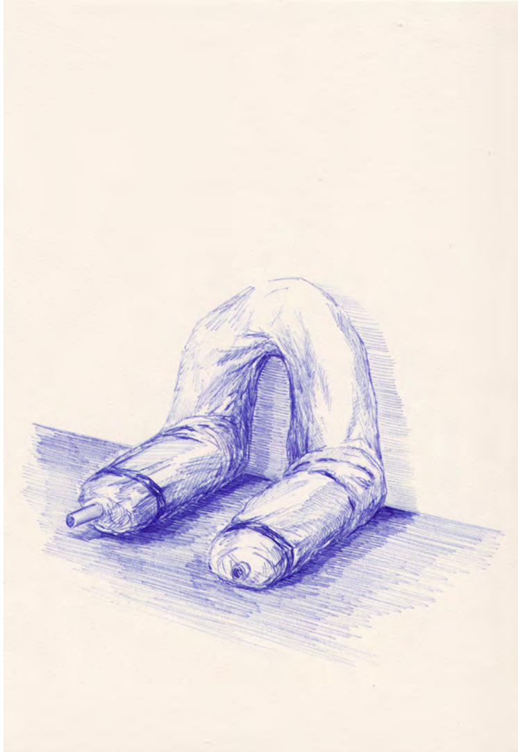
2014 Bulto apoyado formando un arco tinta sobre papel 24x18 cm