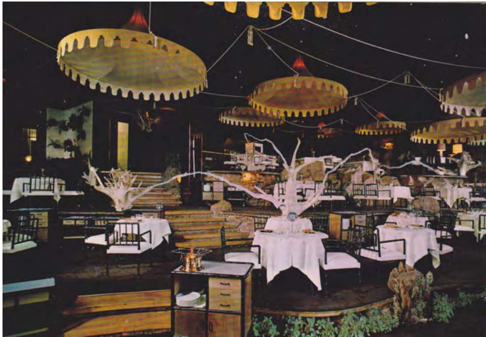
2013 Grill Room óleo sobre postal antigua 10x15 cm