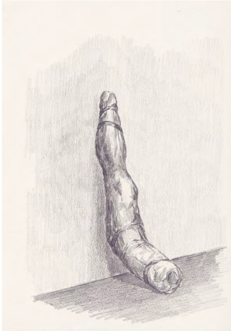
2014 En espera grafito sobre papel 24x18 cm