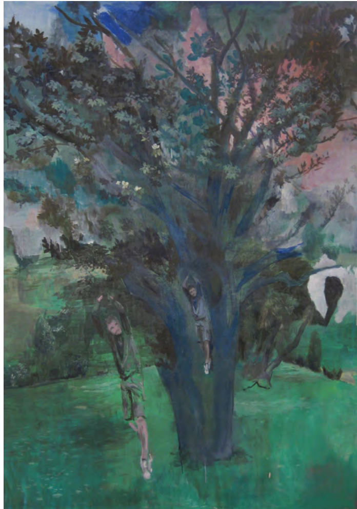
2013 Doble magnolia óleo sobre tela 198x138 cm