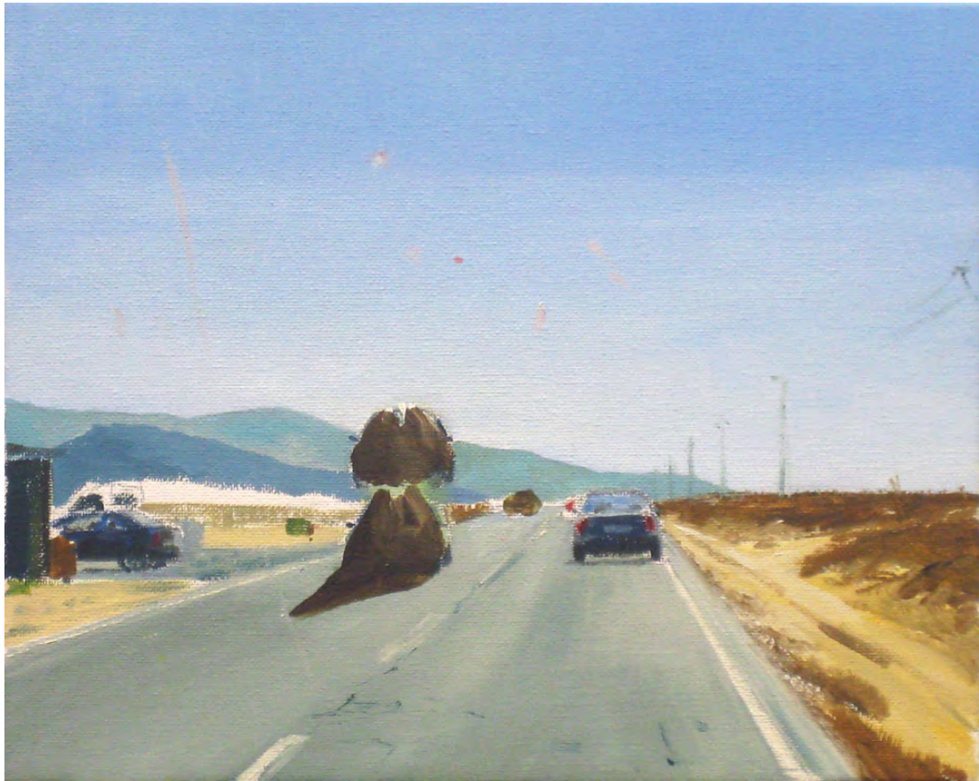
2013 Doble óleo sobre tela 27x22 cm