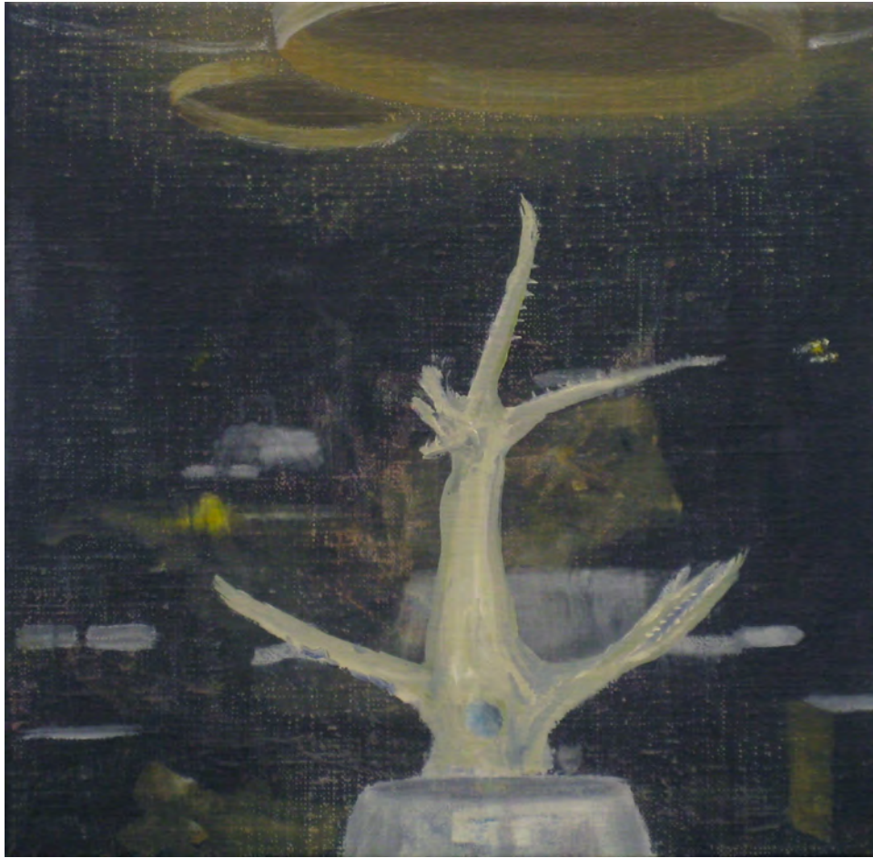
2013 Tronco óleo sobre tela 26x26