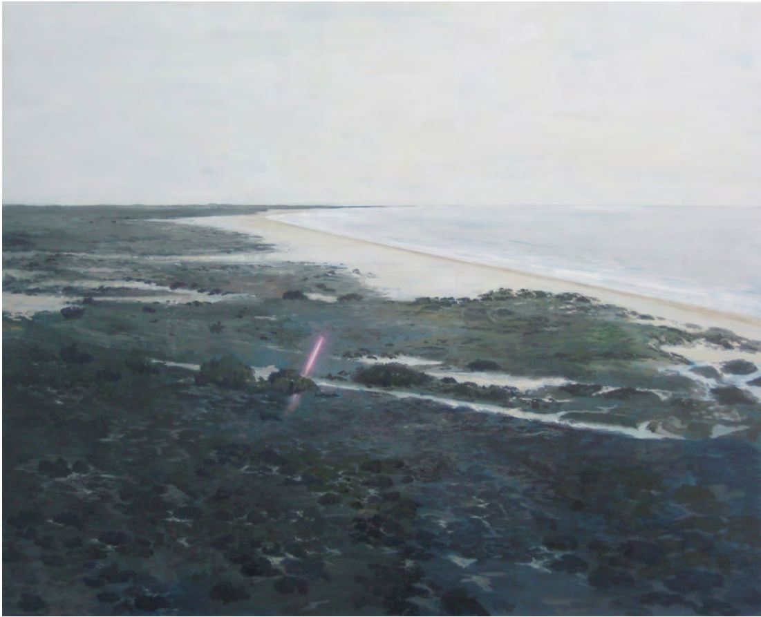
2014 No vuelo óleo sobre tela 100x81 cm