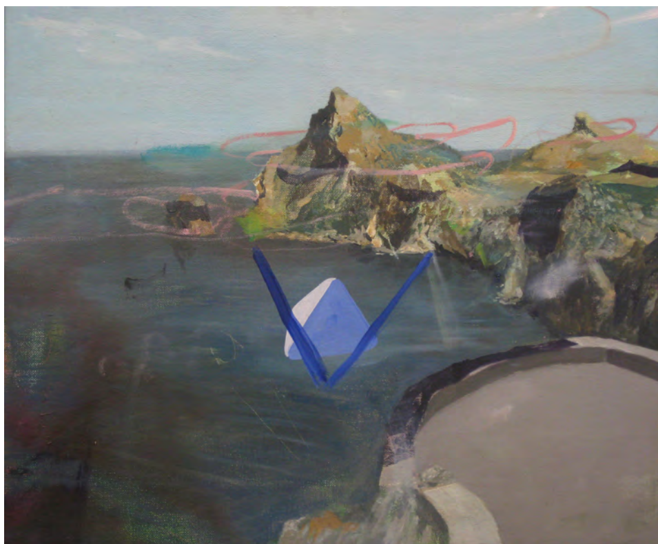
2014 Piramideo óleo sobre tela 46x38 cm

Estos objetos los he usado asimismo como objet trouvé y los he posteriormente manipulado, entremezclando historias y relatos anónimos a otros propios. En estos nuevos registros he introducido anécdotas, acciones domésticas y efímeras, así como objetos de mi entorno cotidiano.