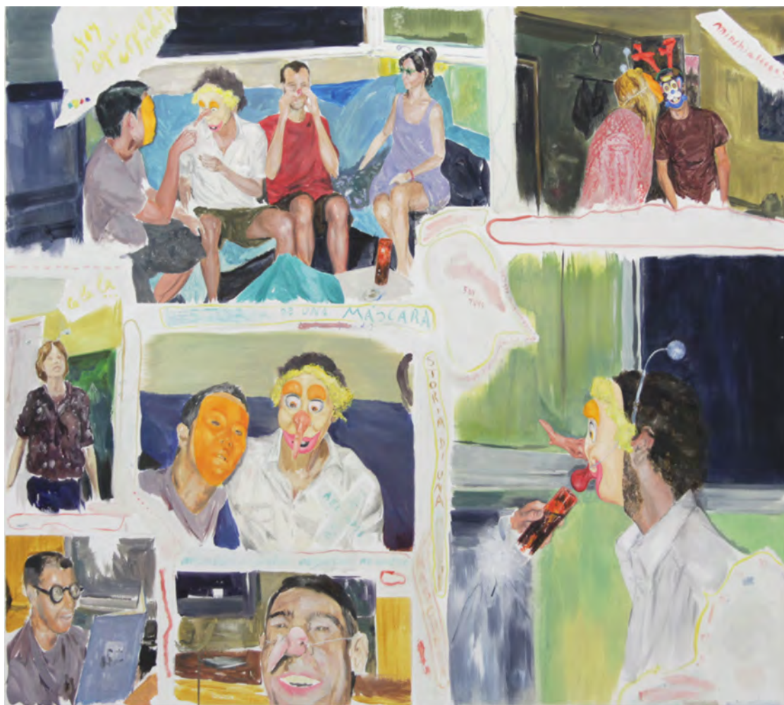
2013 Historia de una máscara óleo sobre tela 162x142 cm