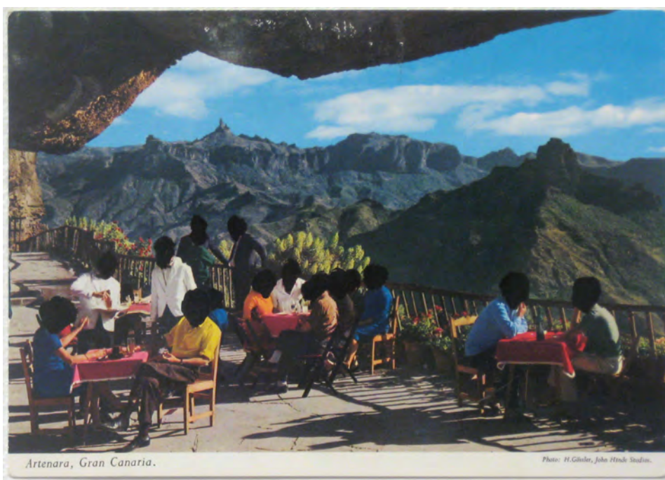
Artenera, Gran Canaria.