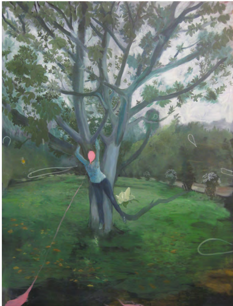
2013 Magnolia óleo sobre tela 195x150 cm