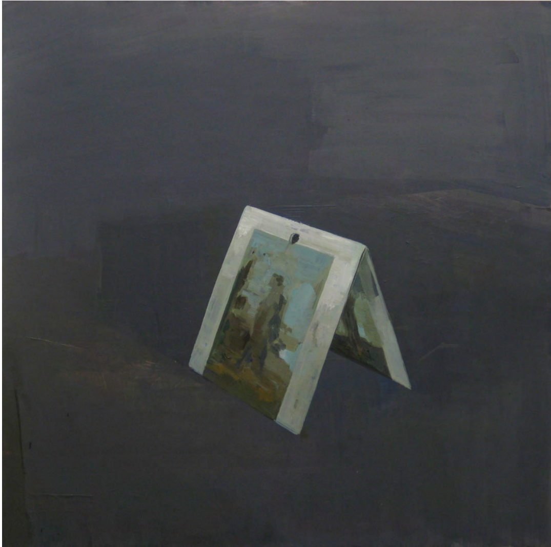
2014 Detrás de una siempre hay otra [#1] óleo sobre tela 60x60 cm