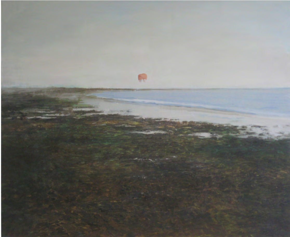
2013 Vuelo óleo sobre tela 73x60 cm