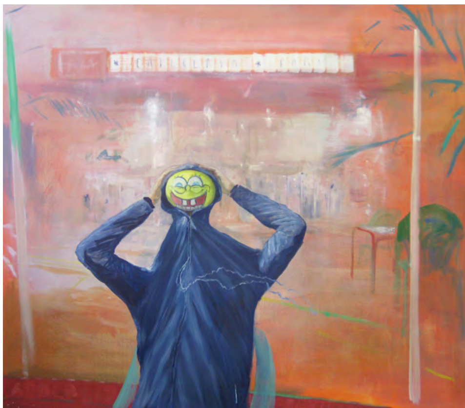
2013 Estoy aquí debajo óleo sobre tela 162x142 cm

Estas obras se basan asimismo en una serie de fotografías domésticas propias donde, más allá del retrato o autorretrato, registran nuevamente en pintura un comportamiento performativo efímero que, sin pretender serlo, es entendido como acción artística.