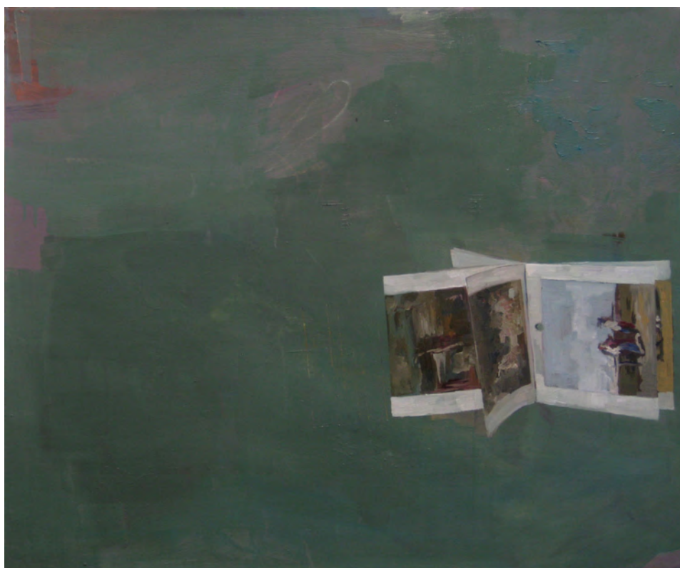
2014 Detrás de una siempre hay otra [#2] óleo sobre tela 73x60 cm

Un calendario con obras del pintor costumbrista J.M. Blanes, impreso en ambas caras, y su colocación casual en una posición determinada, me permitió comprobar la permeabilidad de imágenes y significados, sucediéndose las obras unas detrás de otras. Estas fusiones me sirven para hacer referencia a la dependencia y relacionamiento que tiene una obra con el contexto así como con otras obras, autores o agentes diversos.