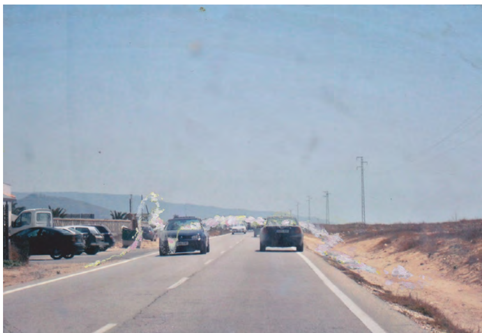
2013 ST [encuentro - Cádiz] tinta y óleo sobre copia fotográfica a color 10x15 cm

Doble quiere indicar a su vez desdoblamiento y continuidad, a modo de enlace o link.