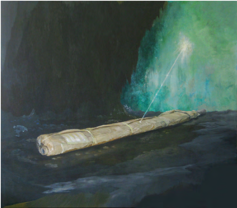
2013/2014 Escondite óleo sobre lino 162x142 cm