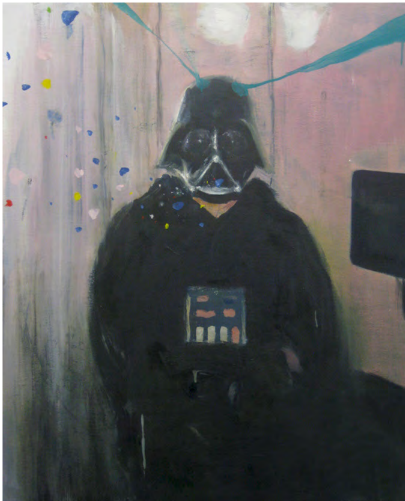
2013 Vader at home 81x65 cm