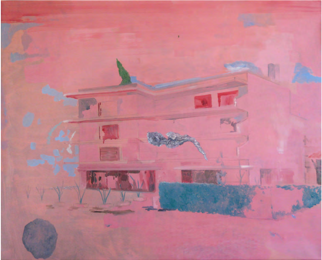
2014 ST [hotel-jardín con restos #1] óleo sobre tela 81x65 cm