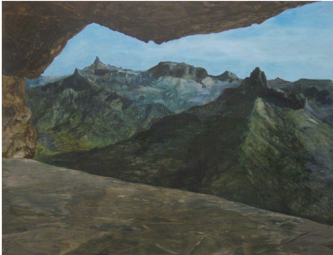
2013 ST [Cueva] óleo sobre tela 146x114 cm