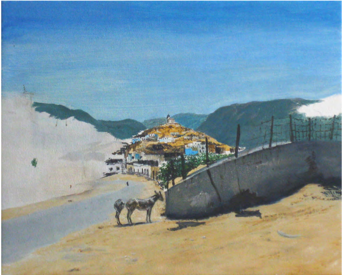
2013 Burro y medio óleo sobre tela 41x33 cm