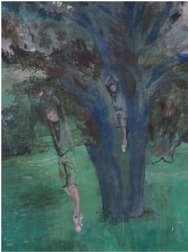
2013 Doble magnolia (detalle) óleo sobre tela 198x138 cm