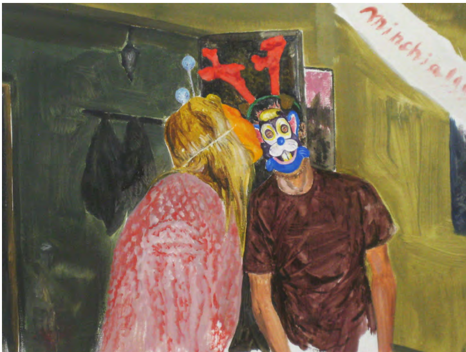
2013 Historia de una máscara (detalle) óleo sobre tela 162x142 cm

Historia de una máscara surge al comprobar cómo una misma identidad momentánea (una careta de cumpleaños) había sido usada por diferentes personas en diferentes circunstancias.