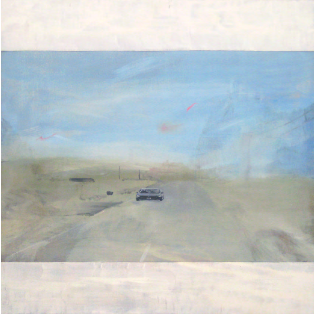
2013 ST [blanco cinemascop] óleo sobre tabla contrachapada 60x60 cm