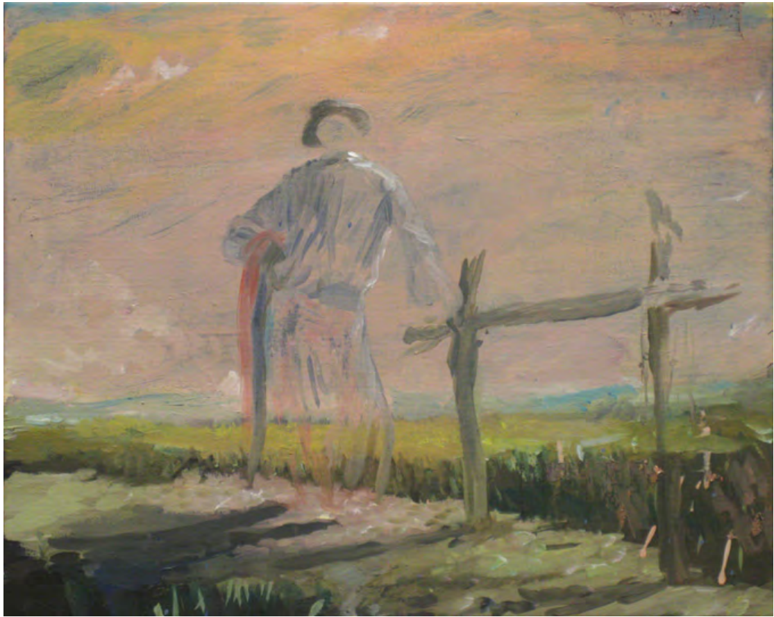
2014 ST [Gauchosco] óleo sobre tela 41x33 cm