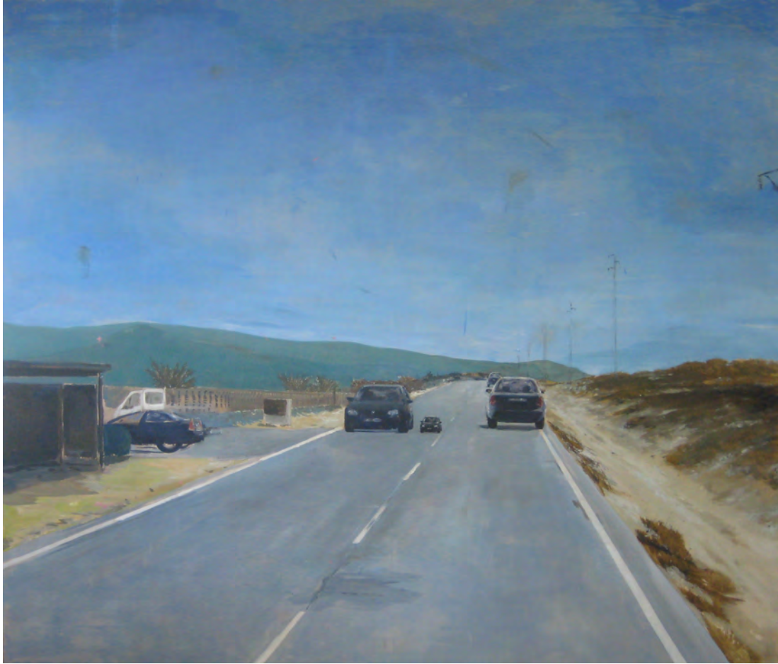
2014 Doble óleo sobre tabla contrachapada 185x147 cm