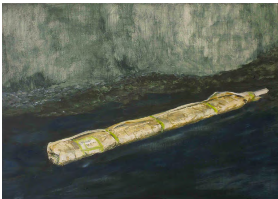
2013 Mis grandes obras óleo sobre tabla 38x24 cm

Entre otras cuestiones, estas obras quieren registrar este hecho y reflexionar, a partir del acto de descubrimiento que implica el encuentro con una obra, sobre el concepto de posesión y de privacidad.