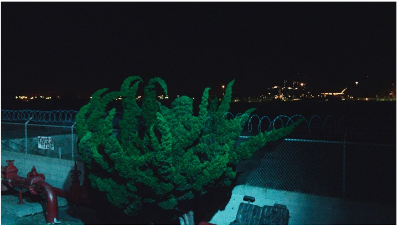
Frame de Nightlife de Cyprien Gaillard.

El video recorre espacios en Cleveland, Los Angeles y Berlín. Ciudades post-industriales grabadas de noche donde las plantas parecen rebelarse contra la arquitectura sacudiéndose y golpeándola. Un video donde el uso del 3D no es gratuito, sino que ejerce una inmersión casi posesiva. Pero aunque pueda tachar el video a nivel visual y sonoro de una gran belleza, ese no está exento de una narrativa. Aquí voy a hacer un copy paste de un artículo que lo explica bien y breve: